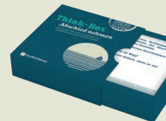
C. Filker, H. Schott Think-Box – Abschied nehmen 30 Impulskarten, die helfen, sich dem Thema Sterben anzunähern. Für Selbstreflexion oder Gespräche. Schiebekarton mit 30 farb. Karten Nr. 156696, € 9,99

„Ganz persönlich, ganz individuell, sehr berührend und vor allem: sehr ehrlich und authentisch.“