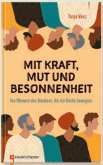
Tanja Wenz Mit Kraft, Mut und Besonnenheit geb., 192 S. Nr. 156850, € 16,00

In kurzen, spannend erzählten Geschichten lernen wir sie aus ganz neuer Perspektive kennen: 16 Frauen und 16 Männer des Glaubens, die die Kirche bewegten und mutig vorangingen. Ihr Vorbild inspiriert bis heute!