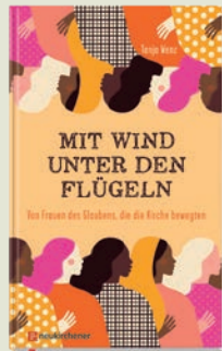
Tanja Wenz Mit Wind unter den Flügeln geb., 218 S. Nr. 156730, € 16,00