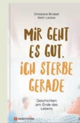
C. Bindseil, K. Lackus Mir geht es gut, ich sterbe gerade Diese todkranken Menschen zeigen, wie viel Wertvolles und Heiteres in der letzten Lebensphase liegen kann. geb., 127 S. Nr. 156326, € 12,99