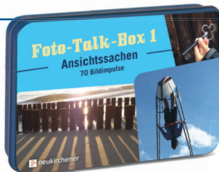
Foto-Talk-Box 1 Ansichtssachen

Foto-Talk-Box Metalldose mit 70 Impulskarten in Postkartengröße je 18,00€*